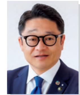
大会長 志摩市長 橋爪 政吉

「伊勢志摩・里海トライアスロン大会 2024」が盛大に開催されますことを心よりお祝い申し上げますとともに、ご来県の皆様を心より歓迎いたします。