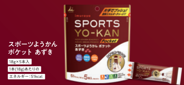
スポーツようかん ポケット あずき 18g×5本入 1本(18g)あたりの エネルギー:51kcal