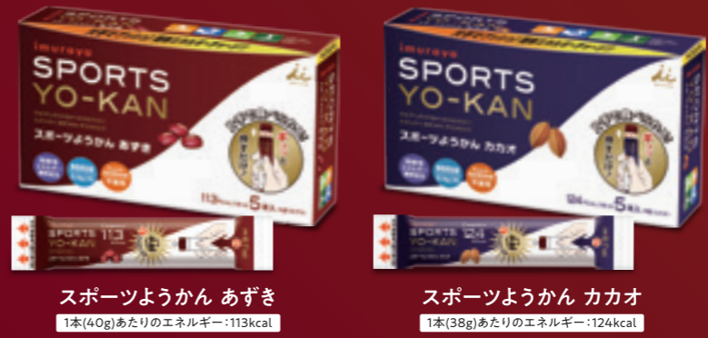
スポーツようかん あずき 1本(40g)あたりのエネルギー:113kcal スポーツようかん カカオ 1本(38g)あたりのエネルギー:124kcal

持続性エネルギー糖質を配合し、 スポーツや日常のもうひと踏ん張りを応援。 カロリーや汗で失われた塩分を手軽に補給できます。