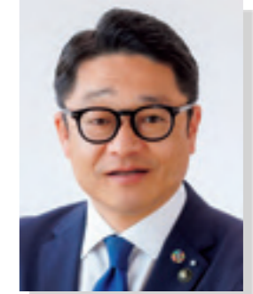
大会長 志摩市長 橋爪 政吉

「伊勢志摩・里海トライアスロン大会 2024」が盛大に開催されますことを心よりお祝い申し上げますとともに、ご来県の皆様を心より歓迎いたします。