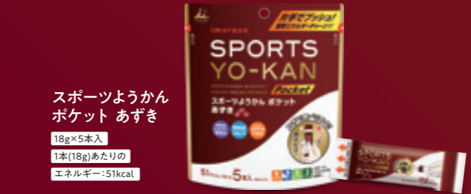
スポーツようかん ポケット あずき 18g×5本入 1本(18g)あたりのエネルギー:51kcal